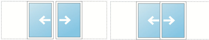
Le galandage 1 vantail sur 1 rail ou 2 vantaux sur 1 rail nécessite une épaisseur d'isolation de 180 mm