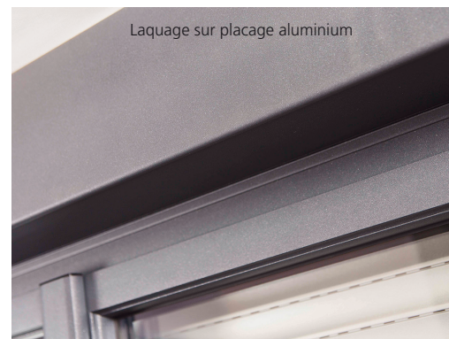
Laquage sur placage aluminium

Enfin, complètement nouveau et particulièrement innovant, Franciافlex propose le laquage sur coffre plaqué aluminium pour un rendu totalement homogène sur les menuiseries aluminium, tout en conservant les performances thermiques d'un coffre en PVC.